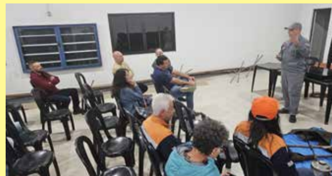
Orientações aos produtores rurais

A iniciativa reforça o compromisso da Prefeitura de Serra Negra com a prevenção de incêndios, a preservação ambiental, a proteção das propriedades rurais e o fortalecimento da atividade agrícola no município.